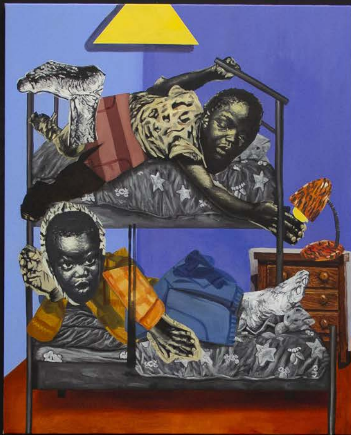
Met Us In Our Pillowcation 160 x 130 cm Oil on linen Villa Arson 2025