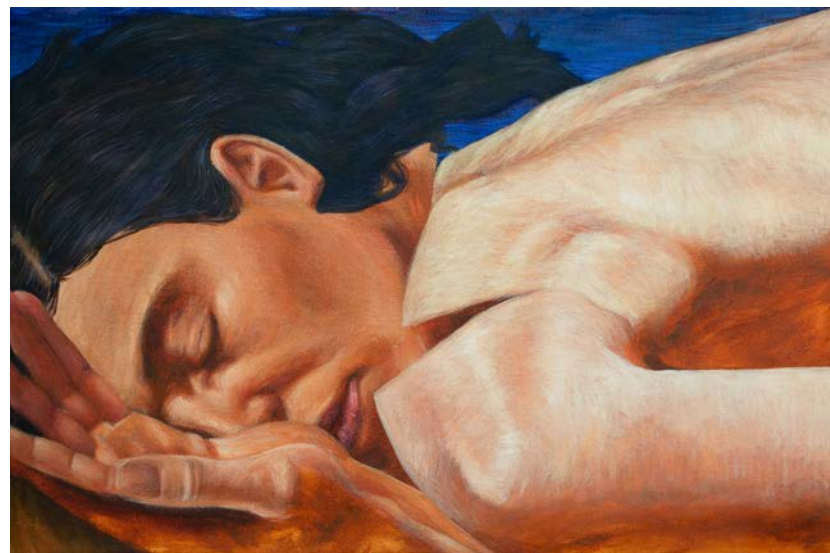
Chevalière 20 x 30 cm Oil on canvas 2024