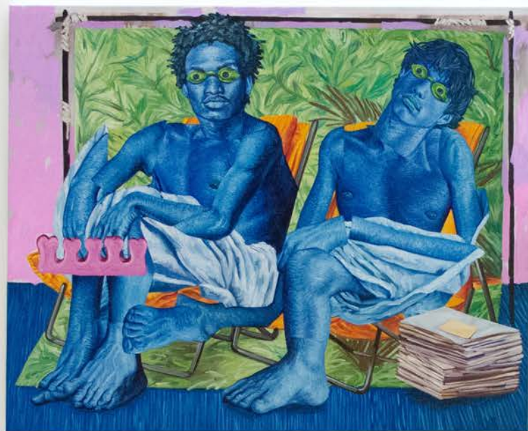
Tropical Coworking 160 x 130 cm Oil on linen Villa Arson 2025