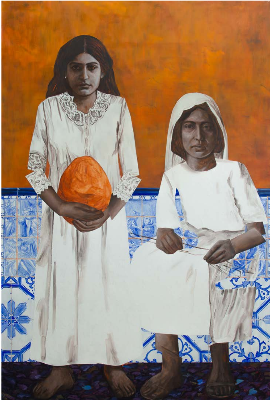
The Egg Ceremony 195 x 130 cm Oil on canvas 2024