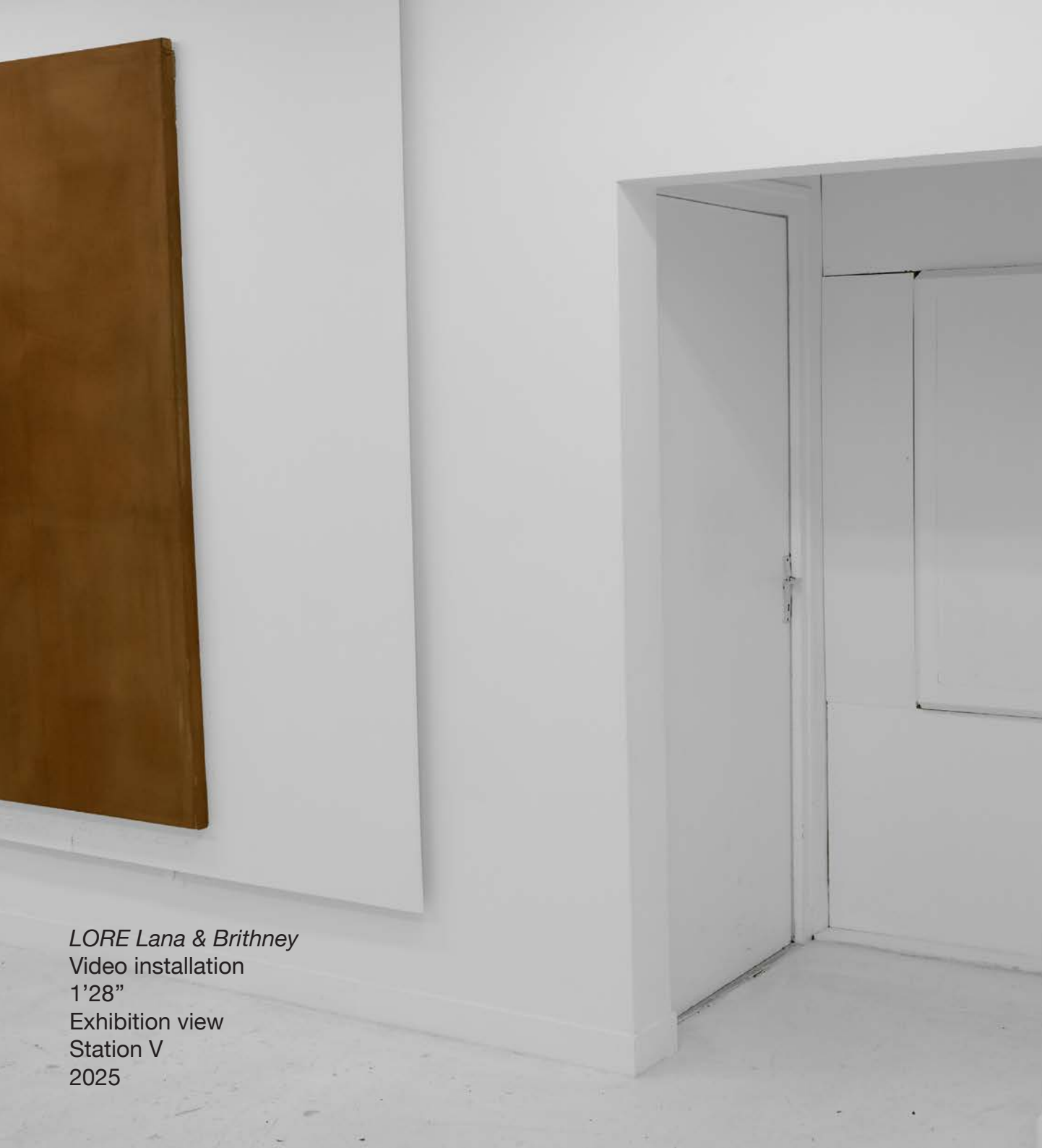
LORE Lana & Brithney Video installation 1'28" Exhibition view Station V 2025