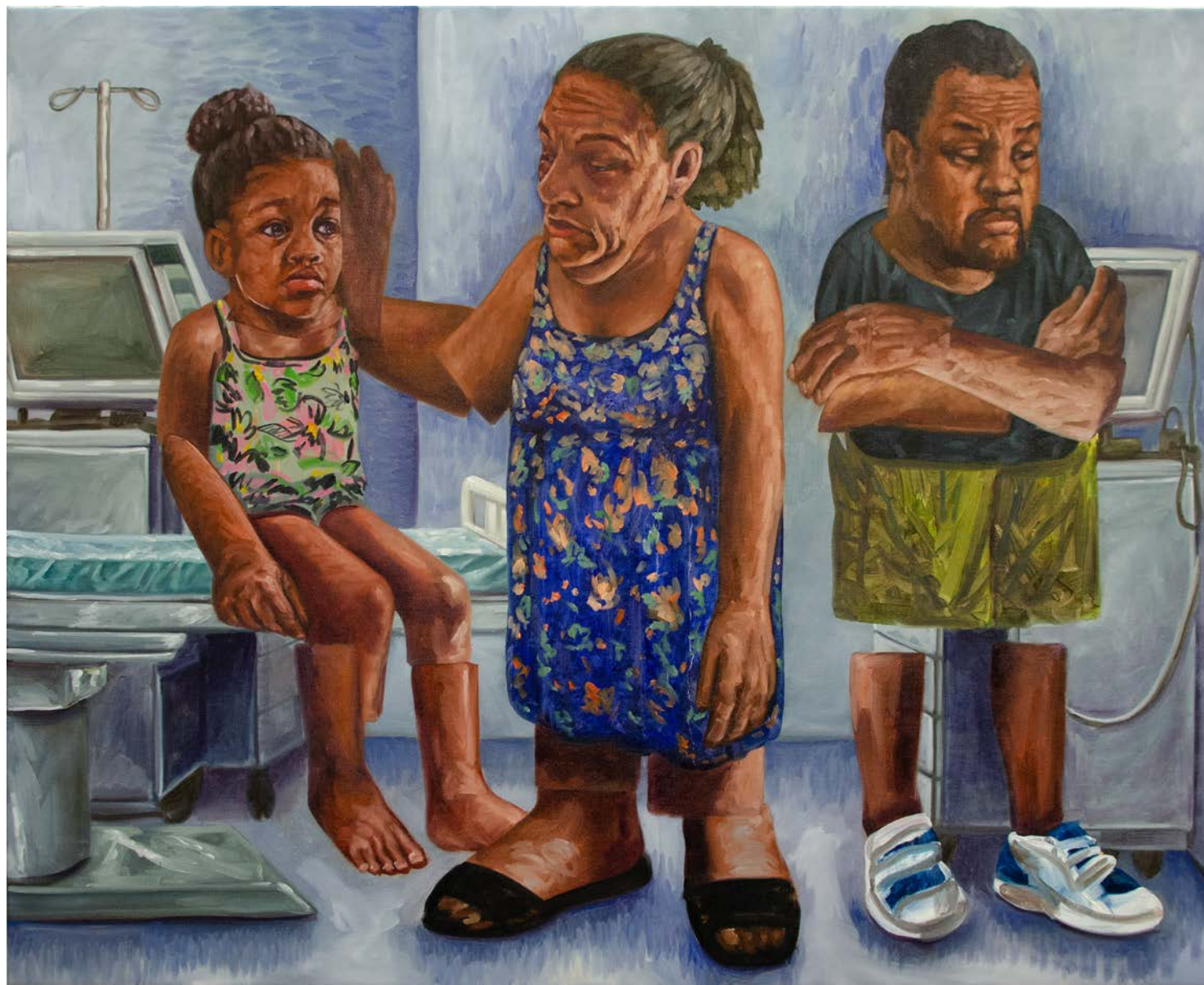
Papa ne sait pas remettre les boucles d'oreilles 160 x 130 cm Oil on linen 2025