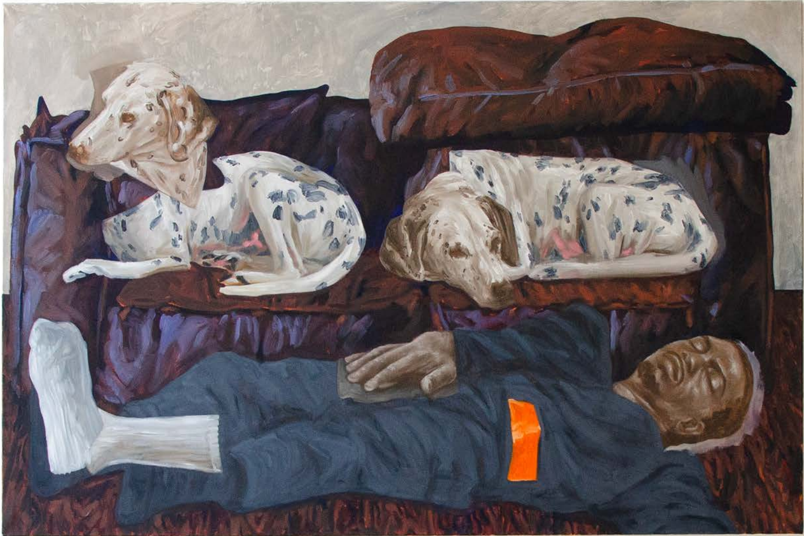
Awareness, Couch Floating