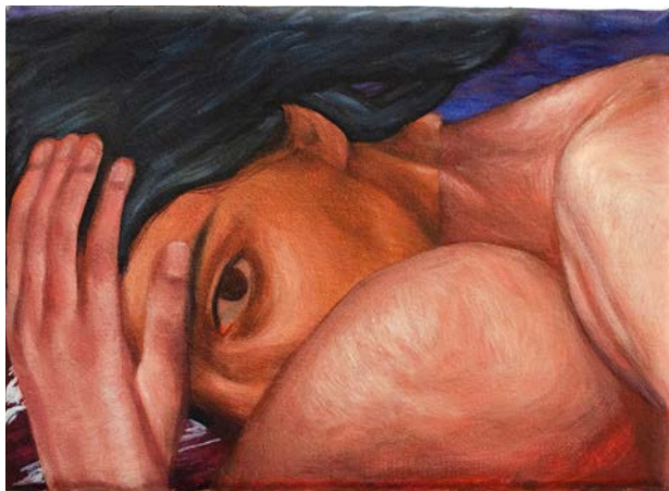
Froissé 18x 24cm Oil on canvas 2024