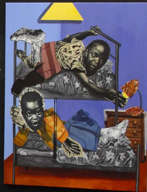
Exhibition view Villa Arson 2025