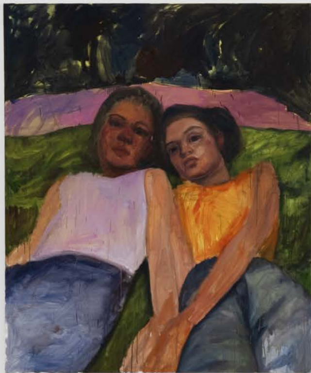
We are maybe watching the end 180x 140 cm Oil Canvas Exhibition view Station V 2025