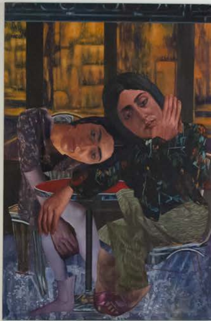
Exhibition view Villa Arson 2024